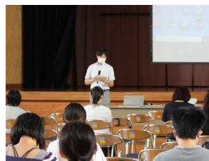
PTA会長あいさつ お忙しい中のご参加、心より感謝申し上げます。

4月にできなかった全体会も実施し、PTA会長からご挨拶をいただきました。また、私からは開校10周年記念事業と西仙北地域子ども見守り隊発足について話をさせていただきました。